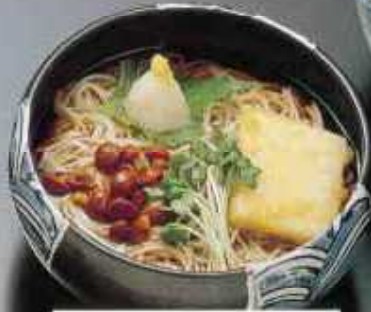
揚げもちおろし 940円