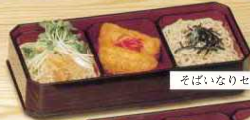
そばいなりセット 840円