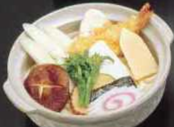
なべ焼うどん(並) 940円