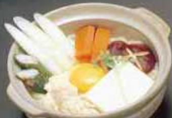
みそ煮込うどん 940円