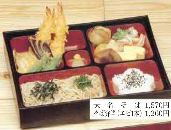
大名そば 1,570円 そば弁当(エビ1本) 1,260円