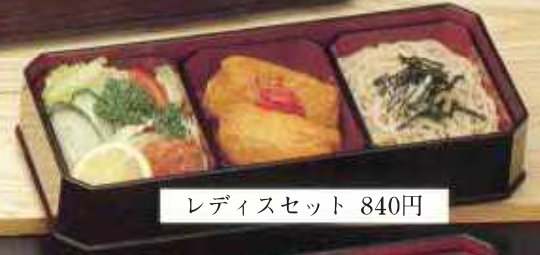
レディスセット 840円